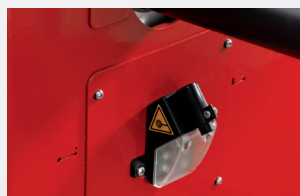
8-21100238 LL Kit Illuminatore interno ruota a LED e puntatore LASER