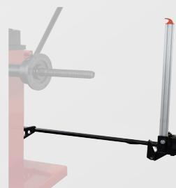
8-21900209 TL-2 UP Rilevatore larghezza cerchio con supporto