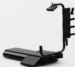
8-21100161/90 WL 80 UP Sollevatore ruota