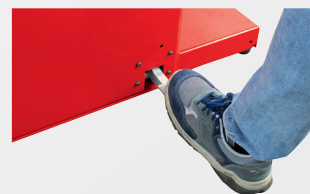
8-21900207 PB Freno a pedale